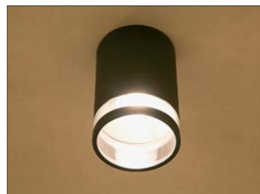
3406 ROCK I plafon ↓ 16,5 cm ∅ 11 cm 1 x E27 max 60W IP 44