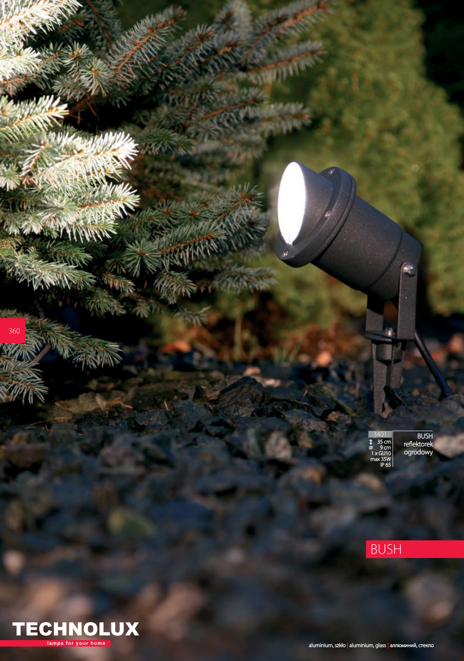
3401 BUSH reflektorek ogrodowy ↑ 35 cm ∅ 9 cm 1 x GU10 max 35W IP 65