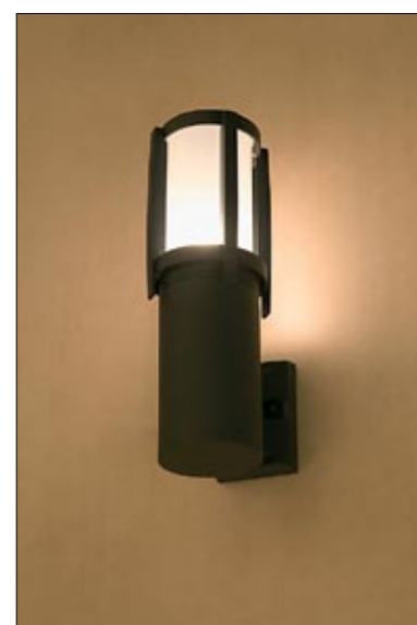
3395 SIROCCO I kinkiet ↓ 32,5 cm ↔ 17,5 cm 1 x E27 max 60W IP 44