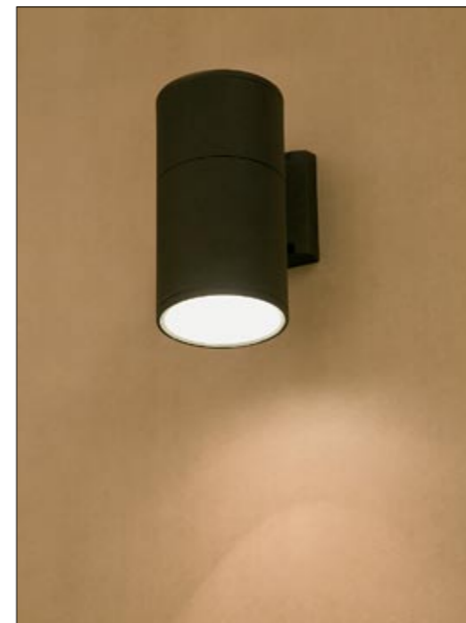
3402 FOG I kinkiet ↓ 20 cm → 17 cm 1 x E27 max 60W IP 44