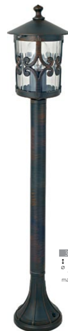
3400 FEN I stojąca L ↓ 90 cm ∅ 16 cm 1 x E27 max 60W IP 44