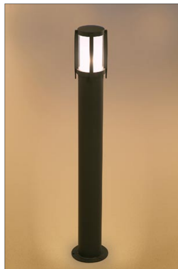
3396 SIROCCO I stojąca ↓ 90 cm ∅ 14,5 cm 1 x E27 max 60W IP 44