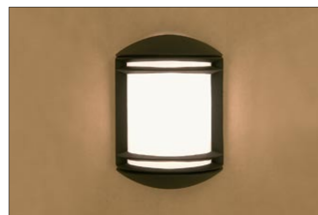
3411 QUARTZ I kinkiet ↓ 26 cm ↔ 18,5 cm 1 x E27 max 60W IP 44

aluminium, PC | aluminium, PC | алюминий, PC