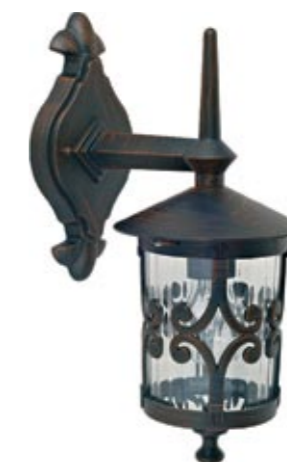
3397 FEN I kinkiet ↓ 38 cm ↔ 23 cm 1 x E27 max 60W IP 44