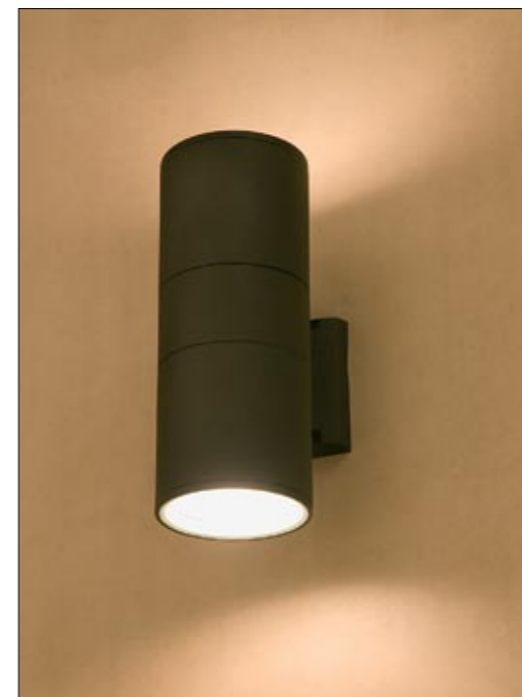
3404 FOG II kinkiet ↓ 27 cm → 17 cm 2 x E27 max 60W IP 44