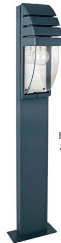
3394 MISTRAL I stojąca ↓ 100 cm ↔ 13 cm 1 x E27 max 60W IP 44