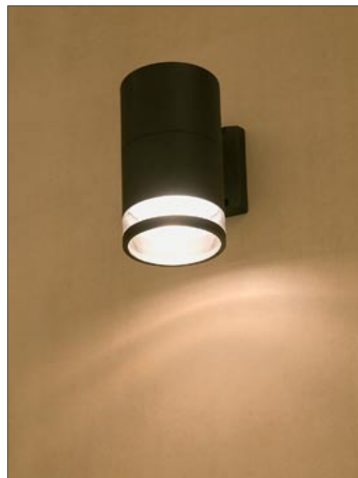
3405 ROCK I kinkiet ↓ 18,7 cm → 17 cm 1 x E27 max 60W IP 44