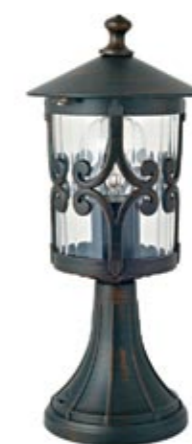
3398 FEN I stojąca S ↓ 30 cm ∅ 16 cm 1 x E27 max 60W IP 44

aluminium, szkło | aluminium, glass | алюминий, стекло