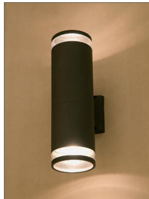
3407 ROCK II kinkiet ↓ 35 cm → 17 cm 2 x E27 max 60W IP 44