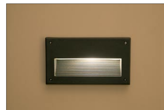
3412 BASALT I kinkiet ↓ 12,5 cm ↔ 22,5 cm 1 x E14 max 60W IP 44

aluminium, szkło | aluminium, glass | алюминий, стекло