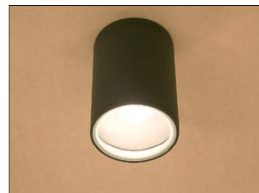
3403 FOG I plafon ↓ 16 cm ∅ 11 cm 1 x E27 max 60W IP 44