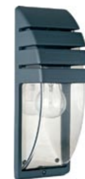
3393 MISTRAL I kinkiet ↓ 35 cm ↔ 11 cm 1 x E27 max 60W IP 44